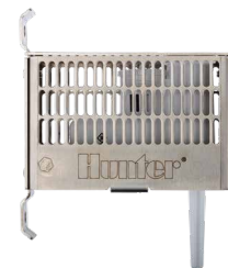
Funksensor-Schutzvorrichtung (mit Montage-Zubehör) Höhe: 7 cm Länge: 9,5 cm Tiefe: 3,2 cm