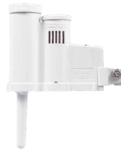
WR-CLIK/WRF-CLIK (mit Montagearm) Höhe: 7,6 cm Länge: 20 cm