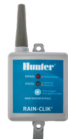
Funkempfänger (mit Montage-Zubehör) Höhe: 8,3 cm Länge: 10 cm