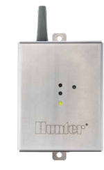
Funkempfänger-Schutzvorrichtung (mit Montage-Zubehör) Höhe: 12,7 cm Länge: 9,5 cm Tiefe: 3,2 cm